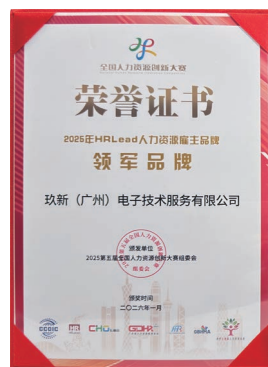
HRLead人力資源僱主品牌領軍品牌 中國國際商會商業行業商會人力資源管理委員會、 HRLead及廣東省人力資源管理協會