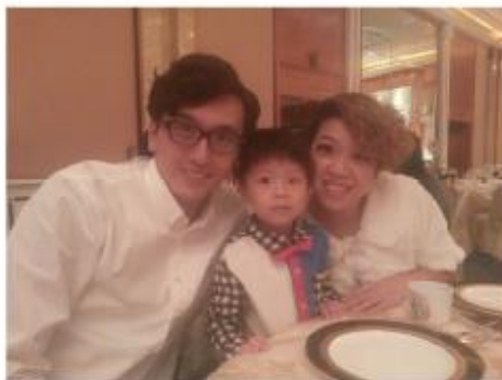
Colo Law District Service Engineer

五年的大學學位終於畢業，期間經歷人生很多挑戰，例如：結婚、小朋友出世、搬屋等重要事件。在忙碌生活中要兼顧長時間學業實在十分艱難。我認為每日只得24小時，我學懂了安排自己時間，準時完成學習功課及課程。